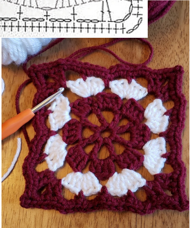
Magic Circle & Wine